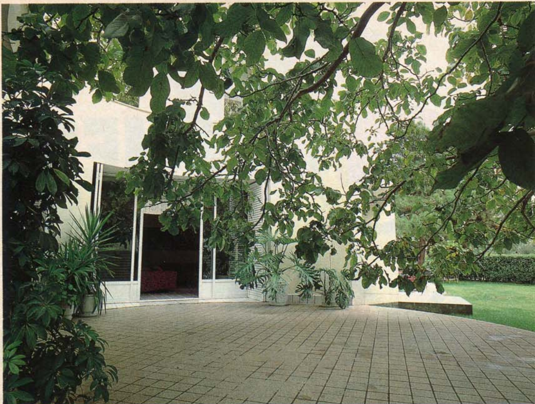
Μοναδική η μεγάλη καρυδιά, είναι φυσική ομπρέλα και σκεπάζει την κυκλική βεράντα του σπιτιού. Ξεχωρίζει η τζαμαρία που την ενώνει με το καθιστικό.