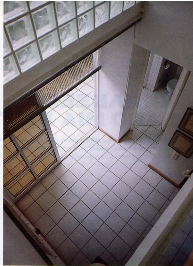
▼ Δυναμικές γραμμές στην κορυφή του σπιτιού: το βεστιάριο και στο βάθος το υπνοδωμάτιο.