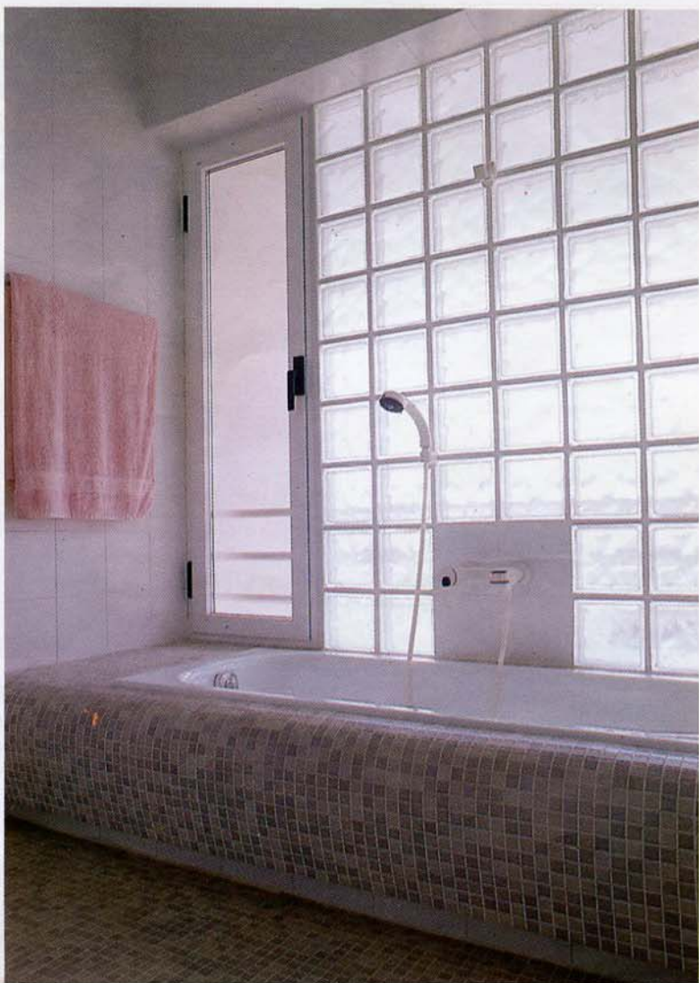
Το λουτρό στο μεσαίο επίπεδο, τα ναλότουβλα και οι καμπύλες στην μανιέρα - ατμόσφαιρα ροής και ηρεμίας.