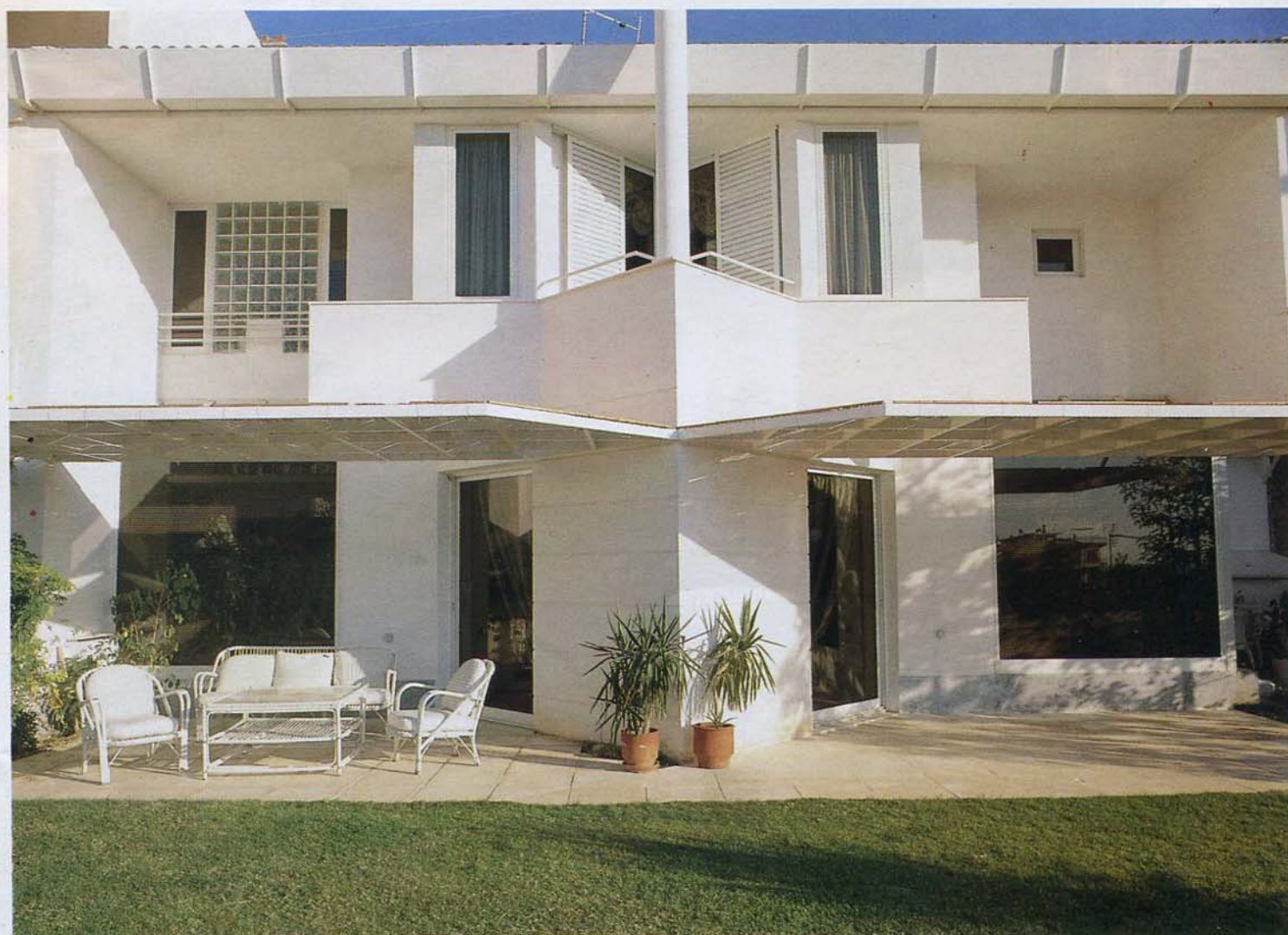
Γενική άποψη από τον κήπο. Η συμμετρία της δυναμικής εικόνας οι όγκοι πάλλονται, χωρίς να συγκρούονται ή να αλληλοκαλύπτονται.

Αρχιτέκτονας: Τ. Εξαρχόπουλος Επιμέλεια φωτογράφισης - παρουσίασης: Μ. Σορίλος