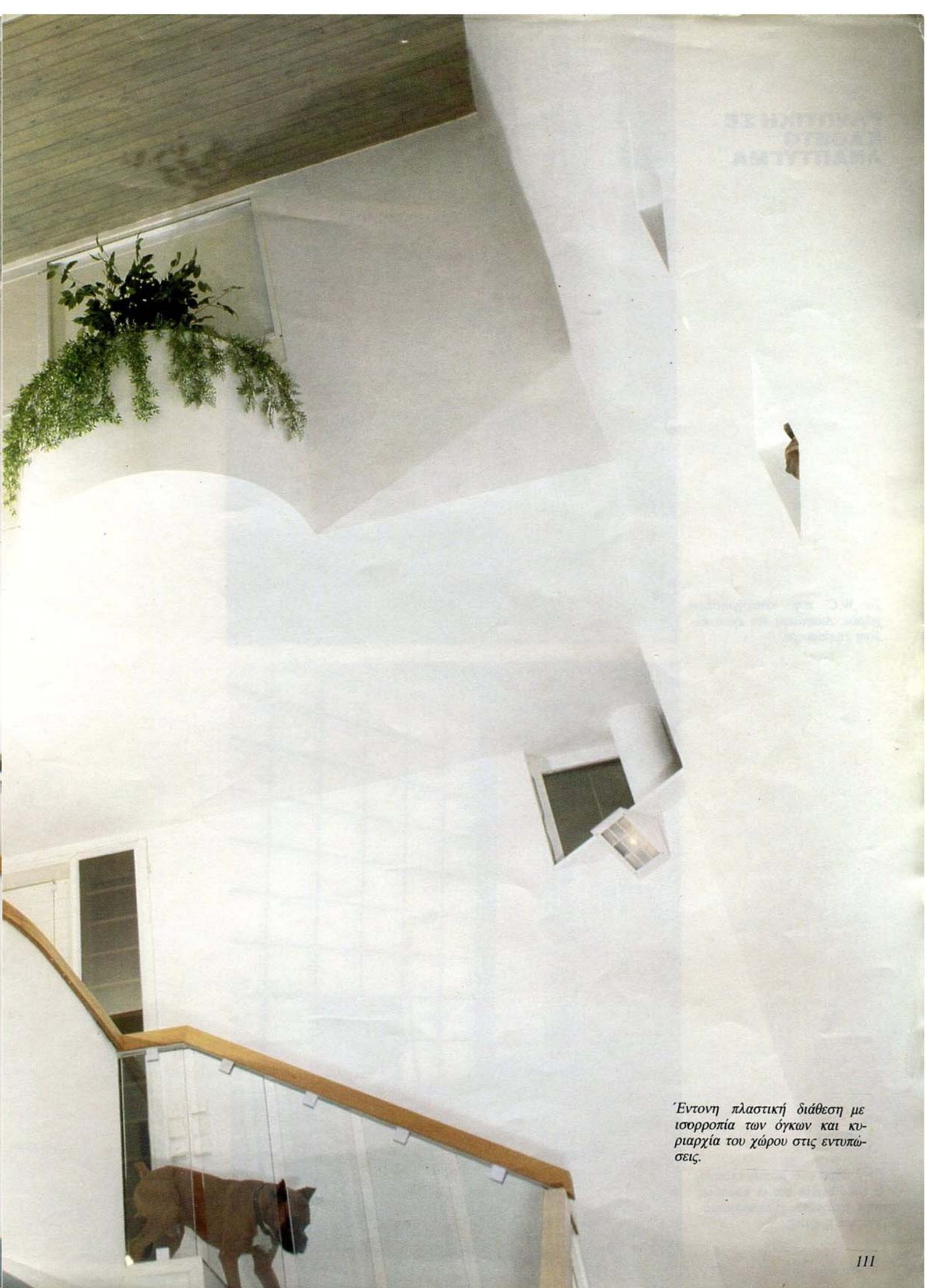
Έντονη πλαστική διάθεση με ισορροπία των όγκων και κυριαρχία του χώρου στις εντυπώσεις.