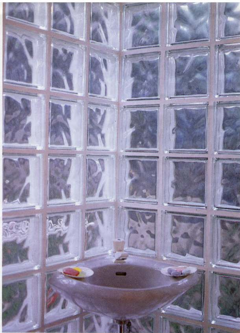
Το W.C. των κοινόχρηστων χώρων. Διαφάνεια και κρυστάλλινη ατμόσφαιρα.